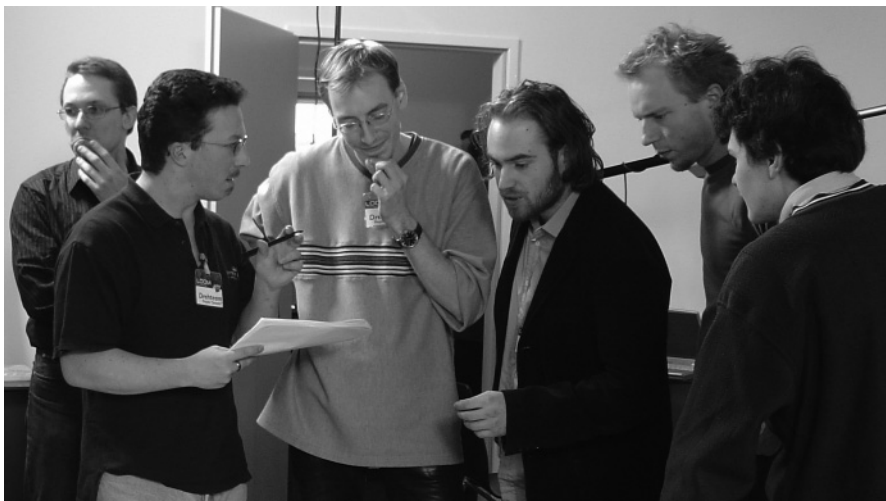
Bild: Szenenbesprechung am Set.

alleinige Weiterentwicklung des Drehbuches von »Jenseits«. Der Schwerpunkt seiner Arbeit lag zu dieser Zeit auf den verbindenden Elementen zwischen den verschiede-