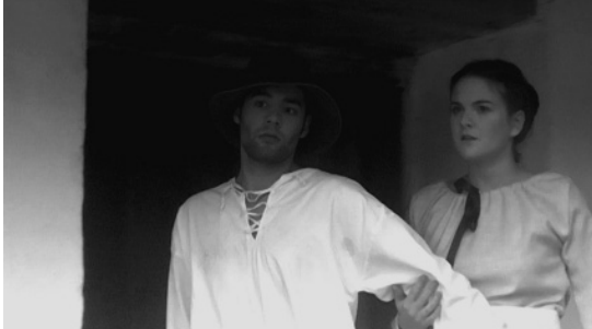
Der Mann stellt sich schützend vor seine Frau.