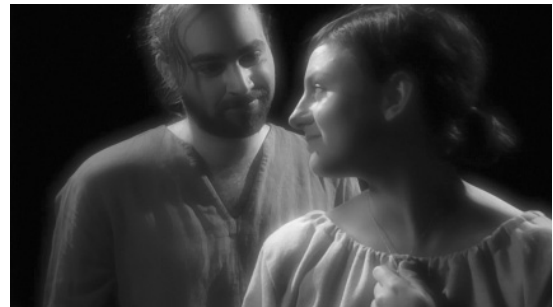
Der Fremde bewundert sein geliebtes Weib.