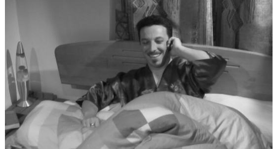
Christian ist ein echter Casanova.