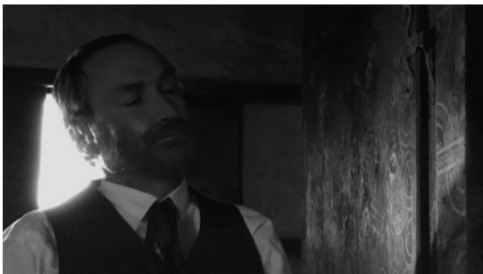
Der Arzt muss unheilvolle Kunde überbringen.