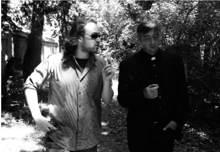
Bild: Der Regisseur bereitet den Darsteller auf die nächste Szene vor.

Diese Erneuerung führte zu starken dramaturgischen Verbesserungen, zog aber auch eine kontinuierliche Überarbeitung der Fassungen nach sich – eine Arbeit, die erst mit dem letzten Drehtag enden sollte.