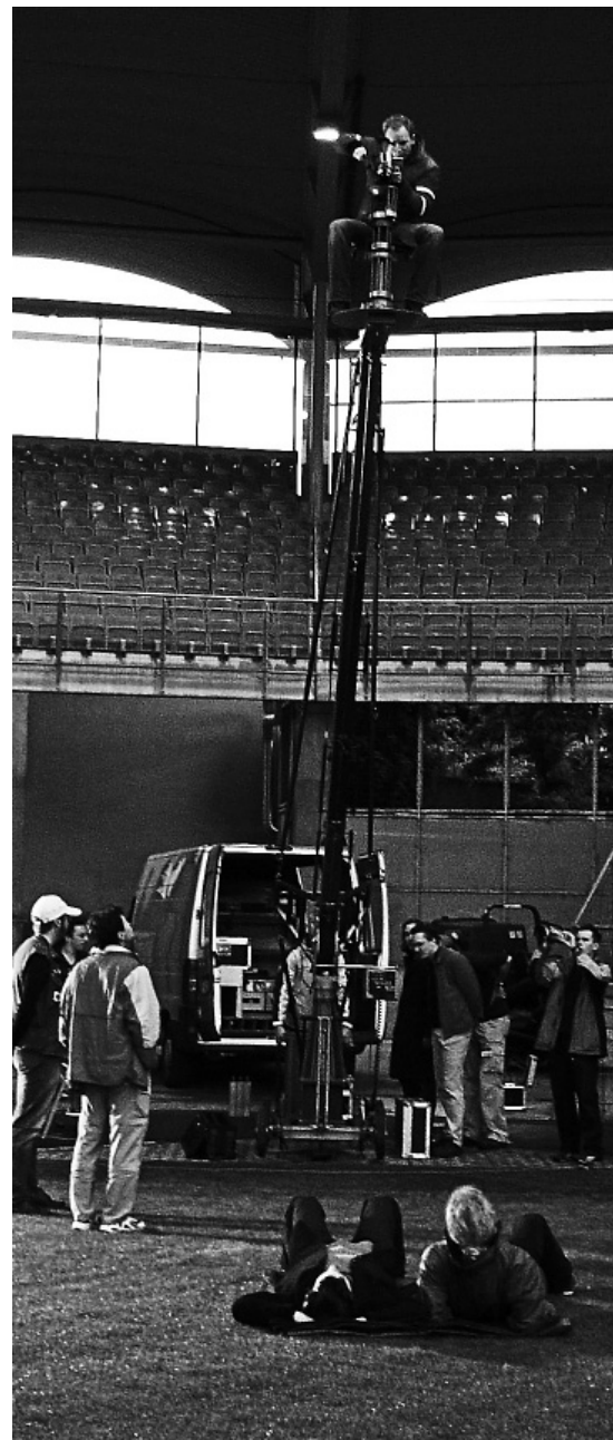
Bild: Aufbau einer Kranszene im Arnold Schwarzenegger Stadion in Graz.

Musikern, einer ausgebildeten Sängerin und authentischen Chören zusätzliche Filmsongs für den Hauptteil von »Jenseits« bei und rundet somit das Gesamtkonzept ab.