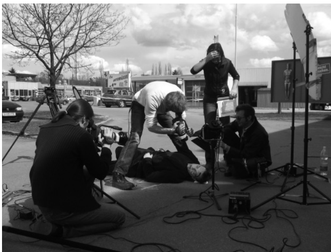
Bild: Doppel-Kamera-Aufbau für ein Close-Up.

Mit dem Mystery-Thriller »Jenseits« produziert die junge Filmgruppe LOOM einen Nachwuchs-Spielfilm, der für österreichische Maßstäbe nicht nur inhaltlich ungewöhnlich ist. Die Erzählung rankt sich um einen fiktiven Mythos rund um die menschliche Vorgeschichte und Entstehung einer unmenschlichen Gestalt, deren Schicksal noch 300 Jahre später – in der Gegenwart des 21. Jahrhunderts – seine Auswirkungen auf die Suche eines jungen Mannes nach seiner verschwundenen Liebe zeigt. Die kunstvolle Verwebung von Mythos und Realität, Vergangenheit und Gegenwart entführt den Zuschauer zwei Stunden lang in eine phantastische Welt jenseits unserer alltäglichen Erfahrungen.