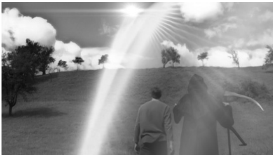
Der Todesbote führt David ins Licht.